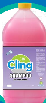
Jabón antibacterial para manos

Pregunta por presentación de 20 litros y fragancias disponibles.