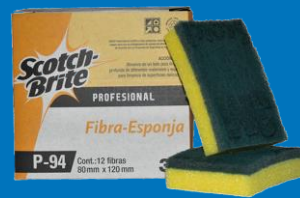
Fibra con esponja