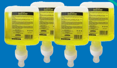
Jabón Espuma 92516