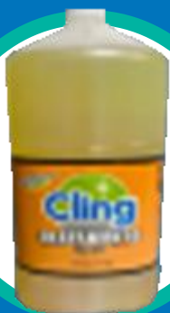
Aceite para mop