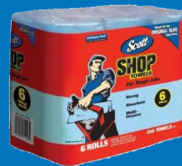
Shop-towel 6 rollos