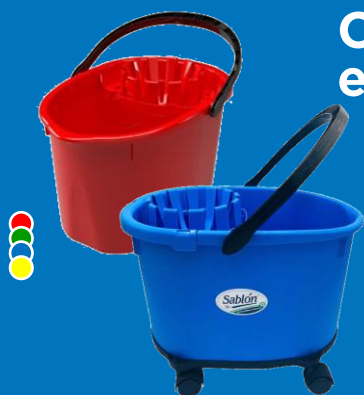
Cubeta con exprimidor 17 L