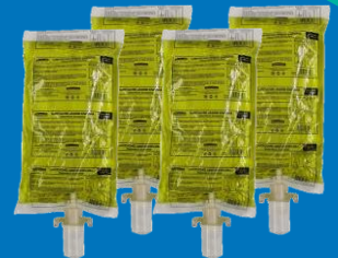
Jabón Espuma 92517