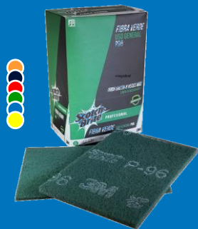
Fibra P-96 multisuperficies