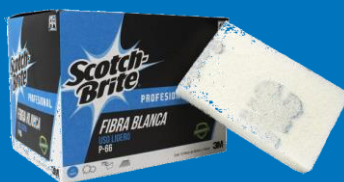
Fibra suave P-66